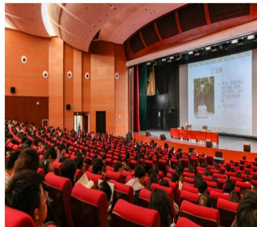
鹿瓦虎席的讲座现场。

家园。文化自信是更基本、更深层、更持久的力量。为了将优秀传统文化有目的、有计划地向所有学生推进,“经典精讲”百堂课讲座从筛选选题到审核讨论,从通知到召集资料收集,“经典精讲”百堂课讲座是全校师生积极参与、影响和带动了全校教师的积极参与。